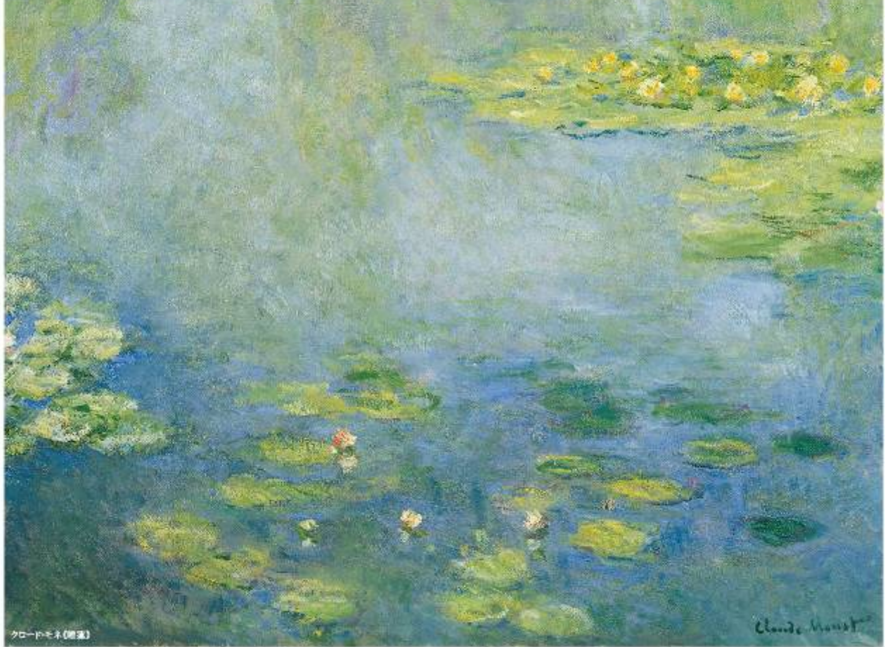
クロード・モネ(複製)